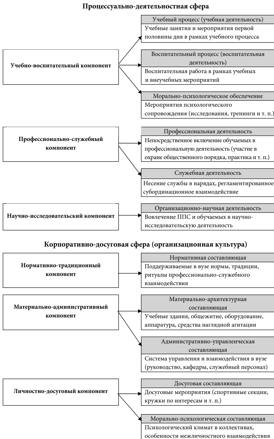
Рис. 1. Структура образовательной среды вуза правоохранительных органов